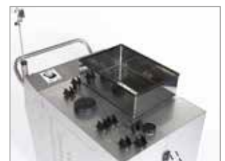
ACERO INOXIDABLE - COMPARTIMENTO ALMACENAMIENTO